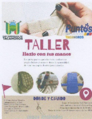
Imagen 1: Taller “Hazlo con tus manos” (bolsos de mano) Punto Digital Tacamoros, Fortalecer habilidades manuales y fomentar el emprendimiento local en mujeres. Se capacitaron mujeres en técnicas de costura y diseño de bolsos, generando un espacio de aprendizaje comunitario.