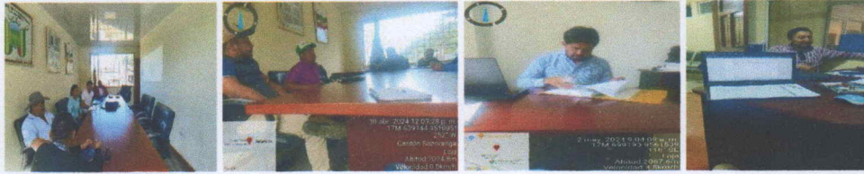
Imagen 10: Seguimiento administrativo a las gestiones planteadas por el Ejecutivo del Gobierno Parroquial.