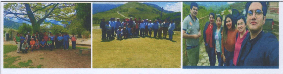
Imagen 15: Peticiones presentadas como vocal responsable de la comisión de vialidad y obras públicas.