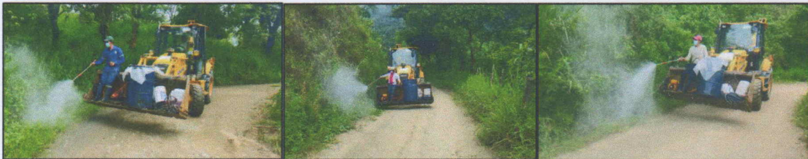
Imagen 02: Participación activa en la ejecución de mingas de limpieza vial en la parroquia.